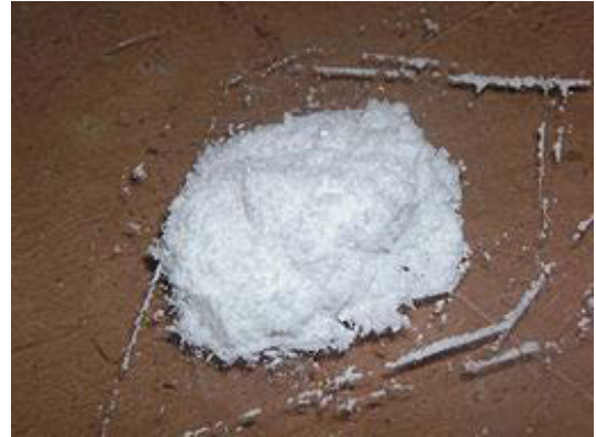
La ketamina