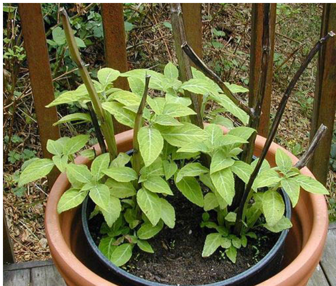
La salvia